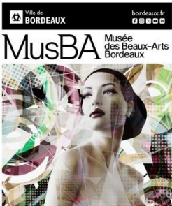
Valérie Belin Les visions silencieuses 24 avr. - 28 oct. 24

Images saturées de signes visuels, l'artiste joue sur les codes de la représentation et trouble les frontières entre réalité et imaginaire. Elle accompagne aussi les mutations technologiques et ontologiques de la photographie, de l'analogique au numérique... en s'appropriant des techniques de surimpression ou de solarisation.